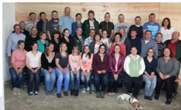
Gruppenfoto von allen Anwesenden beim Grillfest.