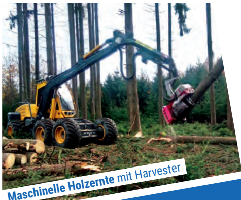
Maschinelle Holzernte mit Harvester